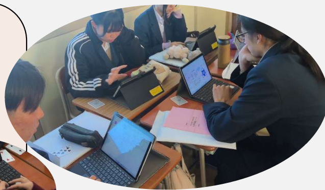
←↑ グループワークの様子